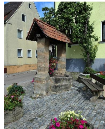
Ziehbrunnen in Röckenhof

Sehenswürdigkeiten: Im Sebalder Reichswald befinden sich eine ganze Reihe von Denkmälern, Gedenksteinen, Brunnen, Quellen und andere Besonderheiten wie: „Hasenstein, Teufelstisch, Ohrwaschel.“