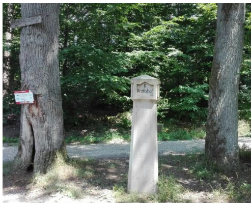
Wolfsmarter im Reichswald